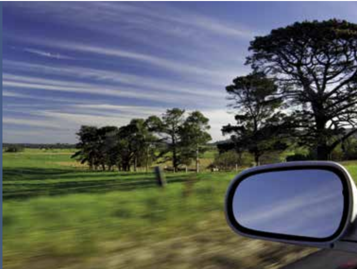
Neue Perspektiven: Saubere Umwelt dank Gasbetrieb