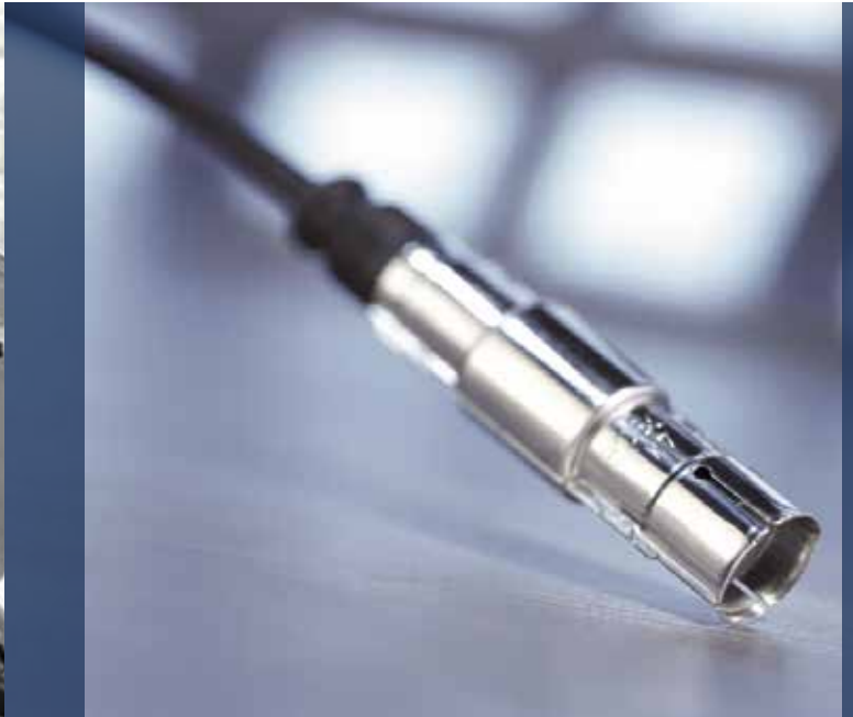
Qualität steckt im Detail: Zündkerzenstecker von Bosch