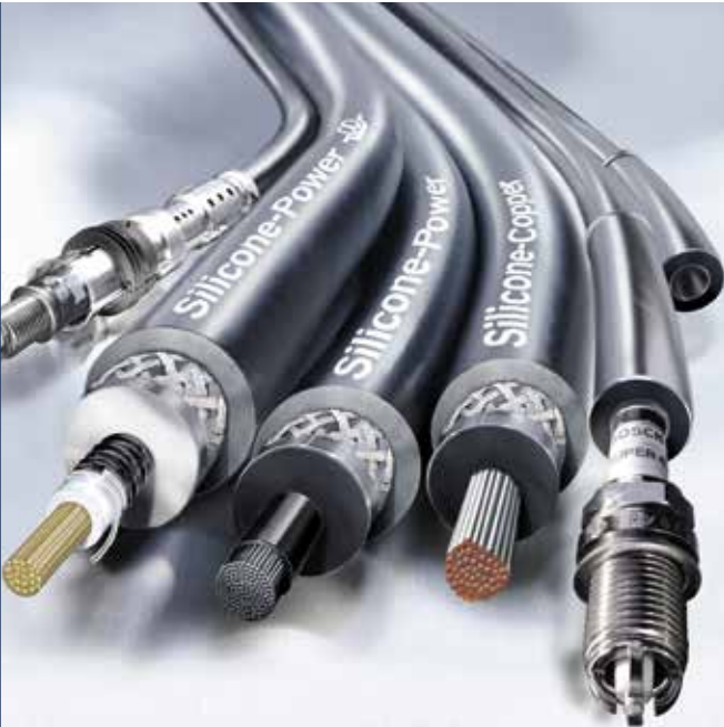
Immer in Verbindung: Zündleitungen von Bosch