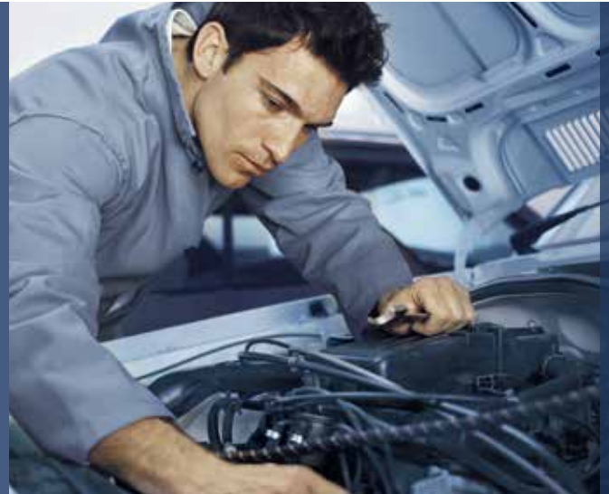
Neue Chancen: Attraktives Geschäft dank Gasbetrieb