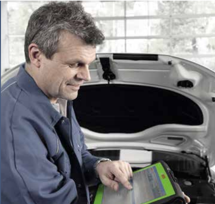
Alles im Griff: Zündung prüfen, Zündkerzen wechseln