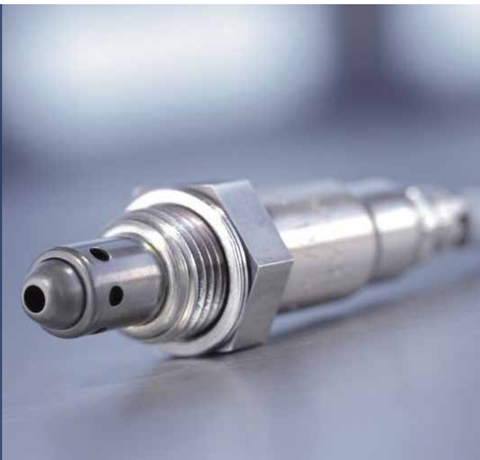
Eine saubere Lösung: Lambdasonden von Bosch