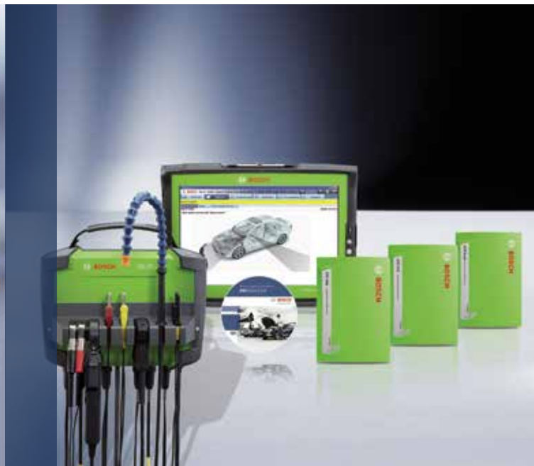
Die KTS 8er-Reihe: Komplettlösungen für Steuergeräte-Diagnose und Fahrzeugsystem-Analyse