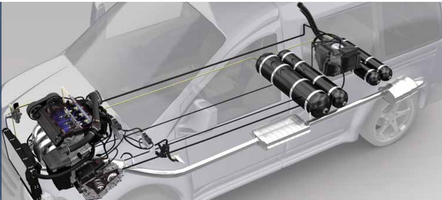
CNG-Kompetenz: Bosch liefert die wichtigsten Teile